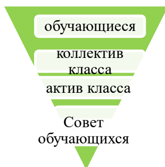
Принцип организации детского самоуправления

В школе развивается и поддерживается ситуативно-деятельностная модель детского школьного самоуправления основанная на коллективном планировании, организации, проведении и анализе детьми (самостоятельно или при участии взрослых) дел, проводимых в школе, в классах, в клубах и секциях.