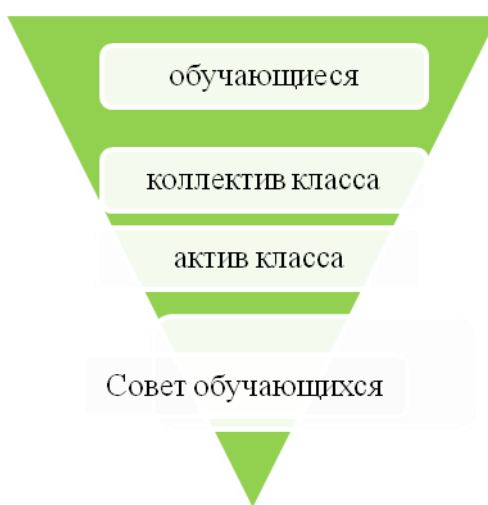
Принцип организации детского самоуправления

В школе развивается и поддерживается ситуативно-деятельностная модель детского школьного самоуправления основанная на коллективном планировании, организации, проведении и анализе детьми (самостоятельно или при участии взрослых) дел, проводимых в школе, в классах, в клубах и секциях.