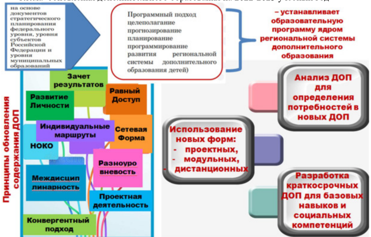
Схема обновления дополнительного образования на 2022-2023 учебный год

Необходимо в следующем учебном году обновление содержания и технологий дополнительного образования детей.